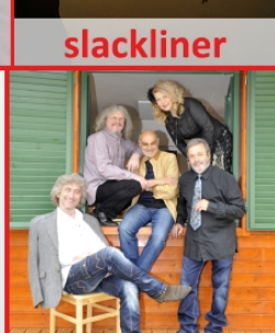
Rangers - Plavci